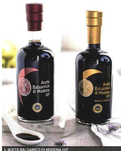
L'ACETO BALSAMICO DI MODENA IGP

Da qui il primato di Csqa anche per le prime certificazioni estere, in Indonesia, dove sono state certificate le indicazioni geografiche, due prodotti iconici del maggiore stato-arcipelago del mondo, il sale marino